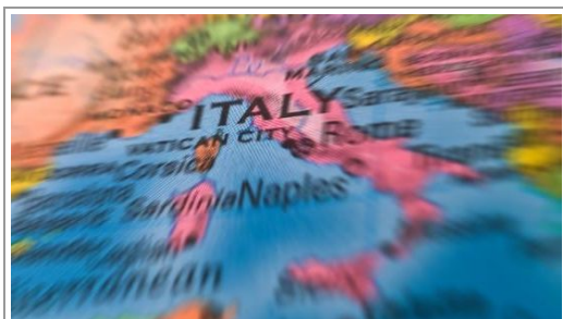
"Per l'Italia, grandi opportunità da cogenerazione e recupero del calore"

Il dato è emerso nel corso della Conferenza sull'Efficienza degli Amici della Terra, dove si è discussa la direttiva quadro sull'efficienza energetica che dovrebbe contribuire agli obiettivi della strategia comunitaria del 20-20-20