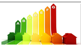
Viessmann e Nuove Energie protagonisti dall'efficienza