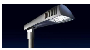
Greenpeace: buona notizia il Nobel al LED